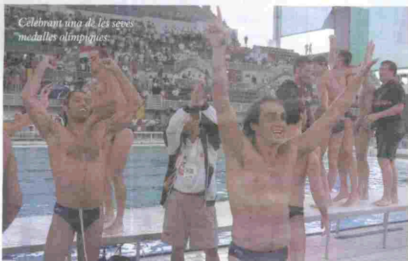
Celebrant una de les seves medalles olímpiques