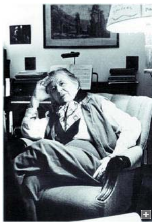
Marguerite Yourcenar, la gran dama de las letras francesas.