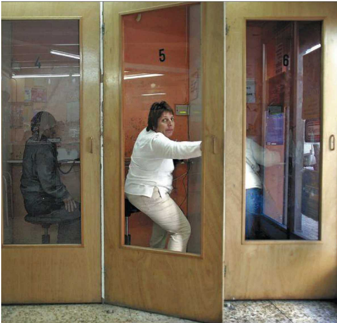
Las mujeres no dejan de preocuparse de la educación de sus hijos en la distancia. Usan el teléfono o el ordenador.

ción de tres años en los que sólo se reunió con ellos una vez. Sus hijos no se amoldan a España; la mayor, licenciada en Psicología, quiere volver y el pequeño ha estado una temporada evitando el colegio. Todo le resulta difícil. "Me pregunta por qué tiene que vivir aquí, no le gusta nada, le está costando mucho adaptarse", explica Estrella. El sentimiento de culpa se multiplica.