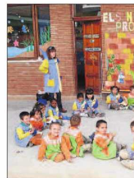
Els nens de Mollerussa es van convertir en p