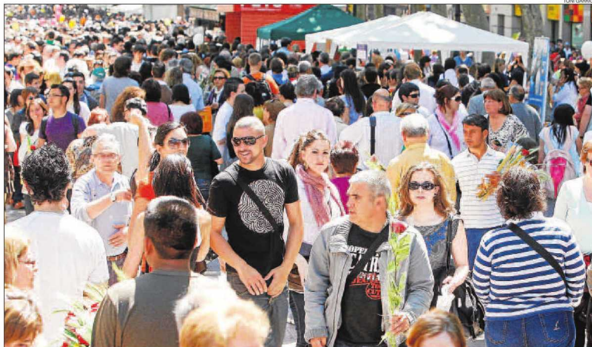
Nombroses persones van passejar per les Rambles de Barcelona durant la jornada festivoliterària de Sant Jordi.