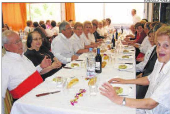
Dinar de la gent gran a Balaguer per celebrar la festivit.