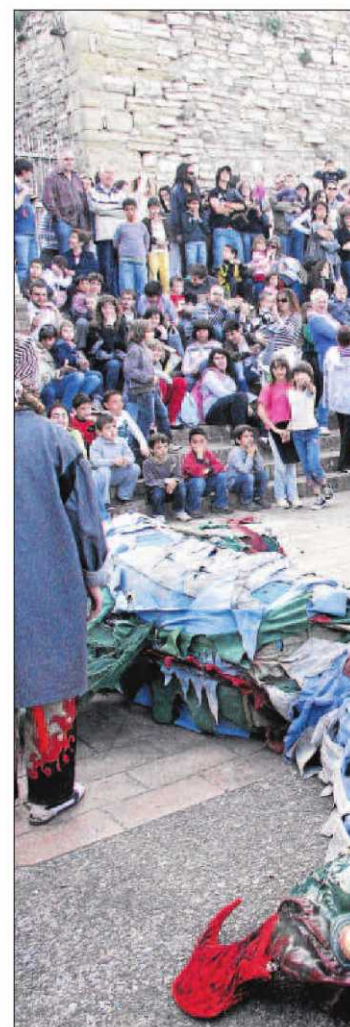
La representació de la llegenda de Sant Jordi a Cervera