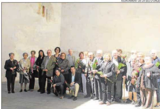
La Seu d'Urgell va celebrar una lectura in viu al pati de la biblioteca.