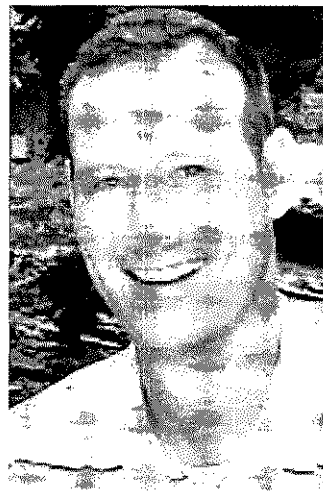
Pedro García Aguado Campeón del mundo de Waterpolo

«No hace falta ser espiritual para mejorar el mundo. Todos podemos hacerlo». Sanllorente dejó el periodismo por los niños de la India